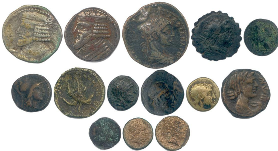
Photo revers taille réduite