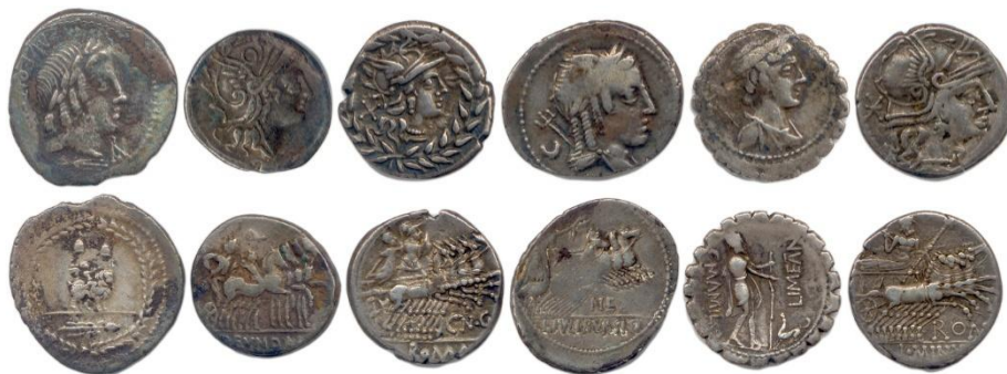
41. RÉPUBLIQUE ROMAINE Fonteia, Fundania, Gellia, Julia, Mamilia, Minucia. Lot de 6 deniers d'argent.