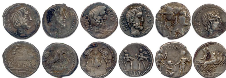
43. RÉPUBLIQUE ROMAINE Tituria, Veturia, Vibia. Lot de 6 deniers d'argent.