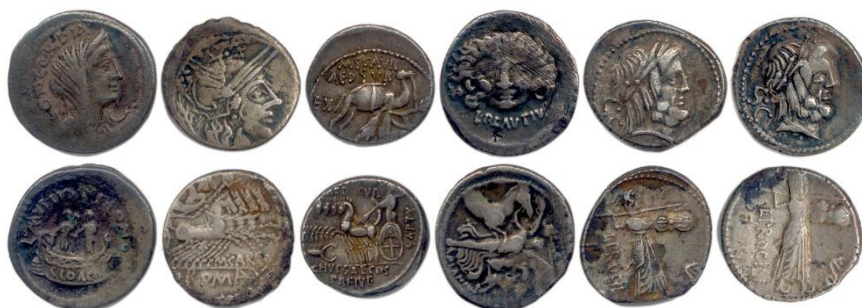
42. RÉPUBLIQUE ROMAINE Mussidia, Papiria, Plautia, Proclia. Lot de 6 deniers d'argent.