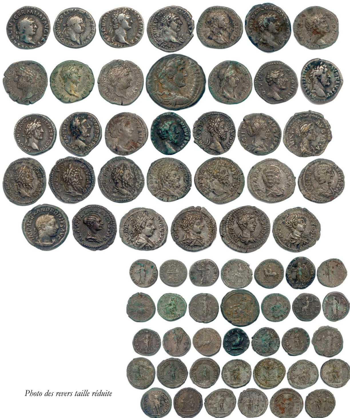
Photo des revers taille réduite