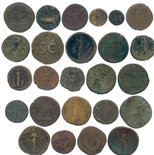
Photo des revers taille réduite