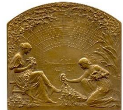
46. Cinq médailles de Belgique en bronze et en cuivre : Exposition Internationale BRUXELLES 1880 Médaille en bronze doré signée Fisch à l'effigie de Léopold II et attribuée à Girard Thibault Exposition Internationale BRUXELLES 1897 Deux médailles en cuivre rouge signée Jules Lagae Exposition Universelle BRUXELLES 1910 Médaille en bronze signée Godefroy Devreese Exposition Universelle et Internationale GAND 1913 Plaquette en bronze signée G. Devreese.