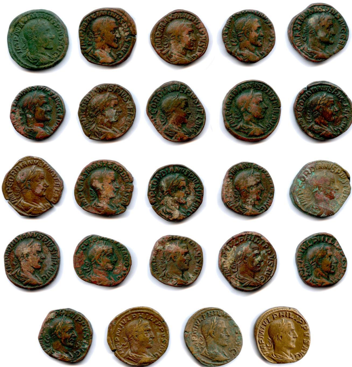
10 Ensemble de 24 sesterces (grands bronzes) de Maximin I er , Gordien III, Philippe II et Volusien T.B. 200 / 220 €