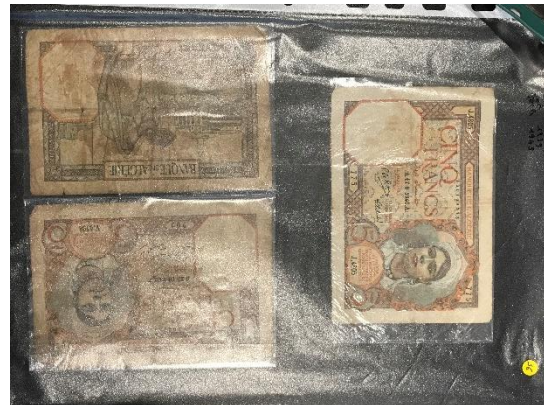
55 Lot de billets français et étrangers (très usagés).