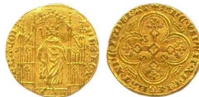
58 CHARLES VI 1380-1422 Écu d'or à la Couronne (3 e émission 11 septembre 1389). Point 18 e = Paris. (3,87 g) Manque de métal. Flan déformé. B. 150 / 180 €